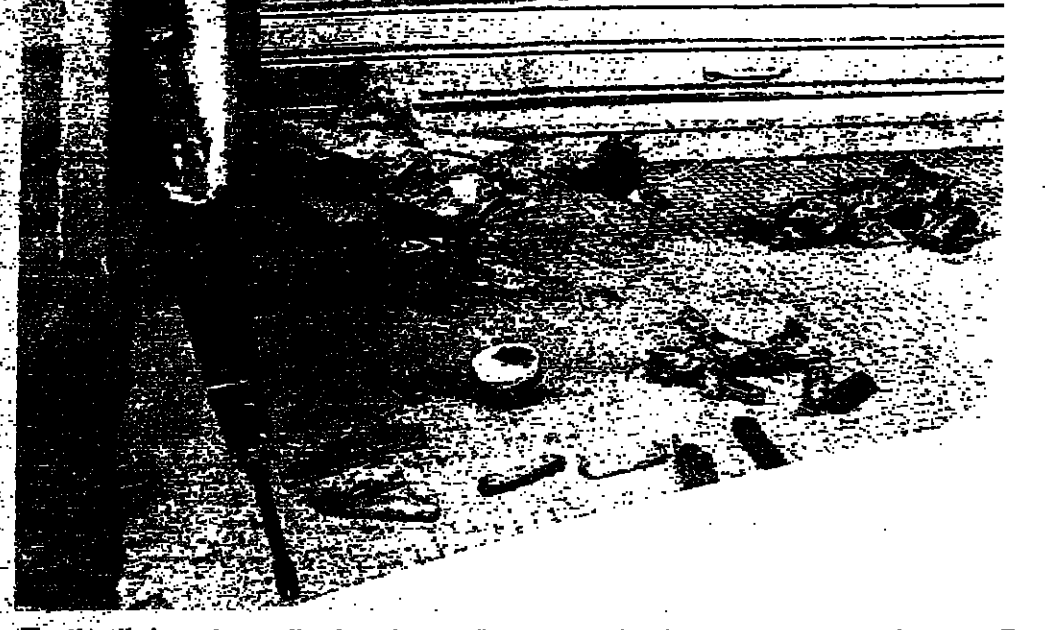
اصليح الديناميت وساعة التوقيت التي كانت مسمدة لتفجير إمام «الهوريس شو» في الحمراء